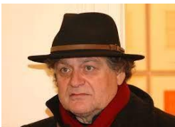
A sinistra la foto dell'artista.

La statua in bronzo realizzata nel 2002 dall'artista ceco è situata nei pressi del quartiere ebraico di Praga (in via Dušň) e riproduce un cappotto gigante e vuoto e un uomo sedutovi sopra a cavalcioni. Ispirata al racconto Descrizione di una battaglia , rappresenta Kafka seduto sul padre, che Franz ha sempre descritto come un uomo enorme e austero. La testa del padre che emerge dal cappotto non ci è mostrata perché Franz dichiarava di avere difficoltà nel guardarlo in faccia. Per finire, Franz è stato posizionato a cavalcioni sul cappotto ironicamente, quasi a far vedere che ha superato la sua paura nei confronti del padre grazie alla lettera che gli ha scritto, la famosa Lettera al padre.